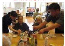
こうすればもっと美味しいよ