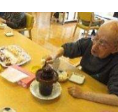
私にもうまく作れました