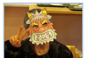
イエーイ!!（節分豆まき）