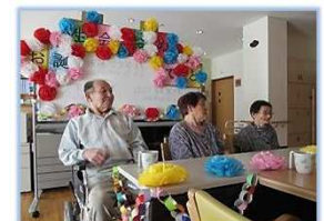
俺、今日の主役（お誕生会）