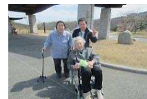
お散歩もできて気分爽快!