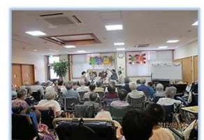
何が始まるのかな？（敬老会）