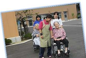
私のひ孫と同じ年だって（好間中学校福祉体験学習）