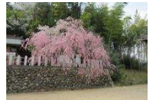
こちらも満開です!