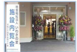
すべてお見せします（内覧会）