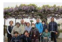
藤棚の前で、はいポーズ!