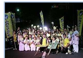
いわき一番!!（いわき踊り）