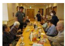
毎日お茶会をしたいね