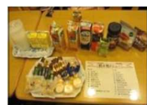
好きなメニューをどうぞ

四月から、毎月「お茶会」を開くことになり、ご利用者様に好きな飲み物・お菓子を満喫していただきました。