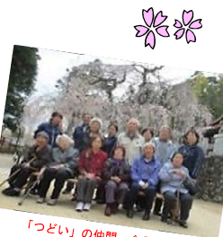
「つどい」の仲間、全員集合!