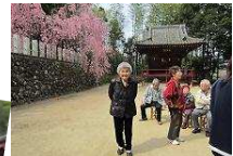
とてもきれいな桜に満足