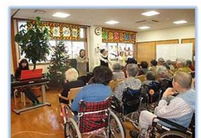
今日は盛り上がるわよ!!（クリスマス会）