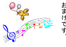
美空ひばりに会ってきました