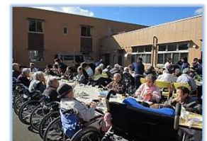
外の食事は最高!!（芋煮会）