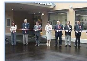
念願のテープカット（開所式）

いわきの里は、平成二十四年六月一日、いわき市好間町で「地域密着型特別養護老人ホーム」として施設の運営を開始し、間もなく一年を迎えようとしています。この間、ご利用者様・ご家族様をはじめとする地域の皆様のご期待に応えられるよう様々なことに取り組んでまいりました。