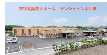
特別養護老人ホーム サンシャインよしま