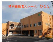
特別養護老人ホーム ひなた

◆ いわきの里では職員を募集しています。 ① 勤務地 「いわき市好間町」 ・地域密着型特別養護老人ホーム サンシャインよしま ・ショートステイよしま ・小規模多機能型つどい 「いわき市明治団地」 ・地域密着型特別養護老人ホームひなた ② 職種 ・介護職(フルタイム) (パート) ※ 夜勤ができる方、大歓迎です。日勤のみでも可能です。 パートの勤務時間は相談に応じます。 資格・経験がない方も、専任の指導担当職員のもと、介護事業の第一歩から安心して実績を積んでいくことができます。また、応募前の職場見学も大歓迎です。 ご希望の方は、履歴書(写真貼付)・職務経歴書をページ下の住所まで郵送して下さい。友人・知人の方で就職をご希望の方がいらっしゃいましたら是非ご紹介下さい。 ◆ いわきの里では、施設の見学・入所のご相談を随時受け付けております。お気軽にご相談下さい。