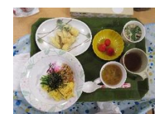
ひなまつり特製の行事食

3月3日、特別養護老人ホームサンシャインよしま、特別養護老人ホームひなた、小規模多機能型つどいにおいて、恒例のひなまつりが行われました。ご利用者様には、お寿司などのひなまつり特製の行事食が提供されました。また、サンシャインよしまでは、七段ひな飾りも登場し、ご利用者様や来所された皆様の目を楽しませていました。