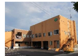
特別養護老人ホーム ひなた

いわきの里では、各施設の見学、入所のご相談を随時受け付けています。お気軽にご相談下さい。なお、事前にお電話をいただければ幸いです。