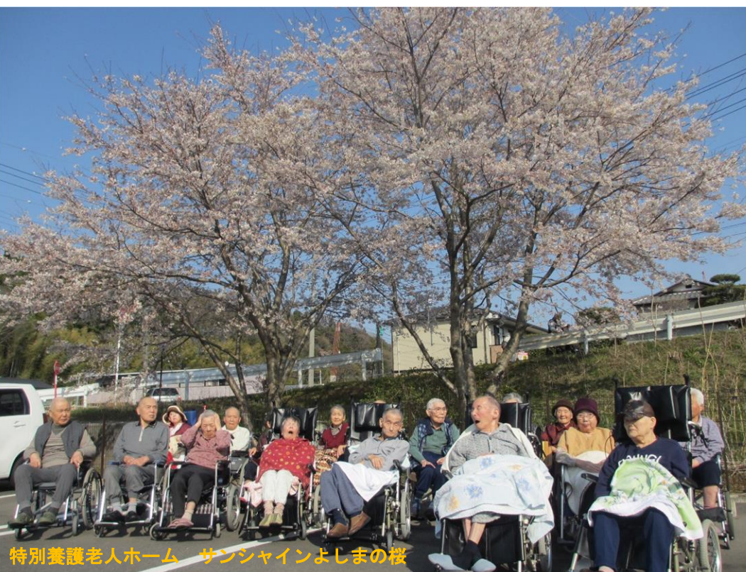
特別養護老人ホーム サンシャインよしまの桜