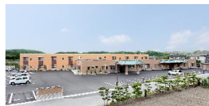
特別養護老人ホーム サンシャインよしま