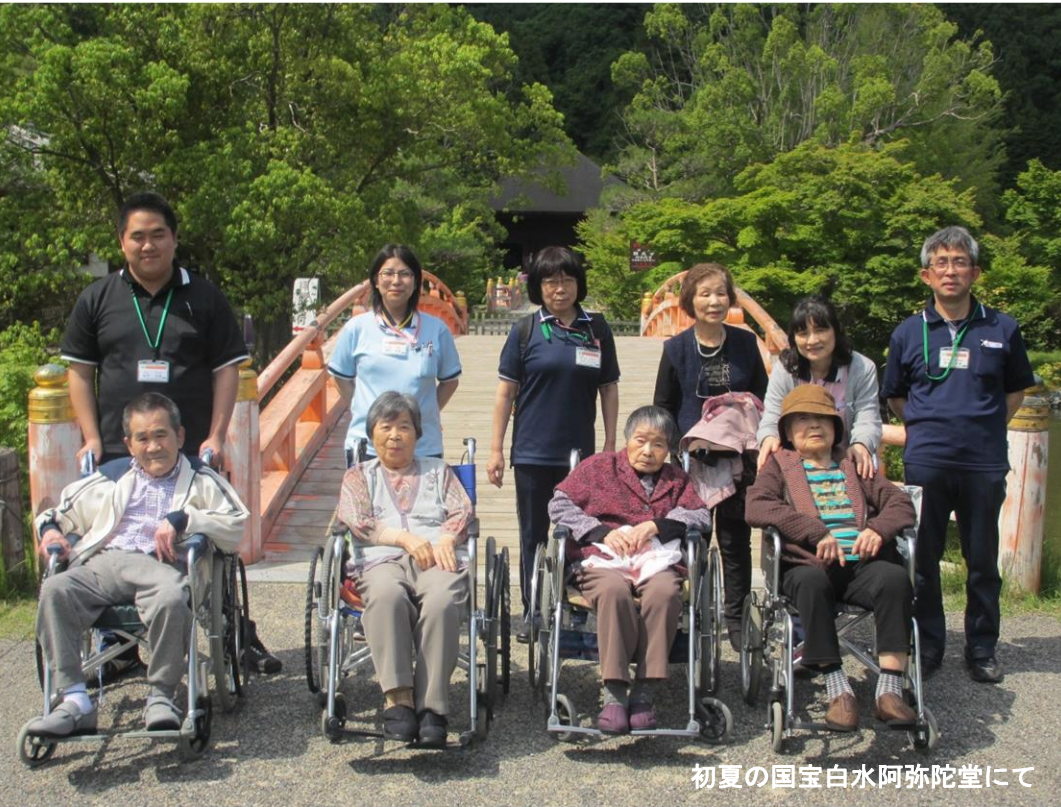
初夏の国宝白水阿弥陀堂にて